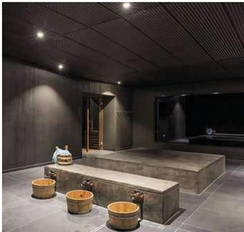
Fussbecken mit Nabelsteinen, Dampfbad und Bio-Soft-Sauna sind Teil der Wellnesswelt.