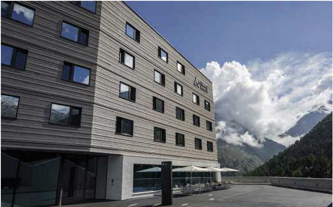
Das neue Hostel in Saas-Fee steht auf einem Hochplateau über dem Saastal.