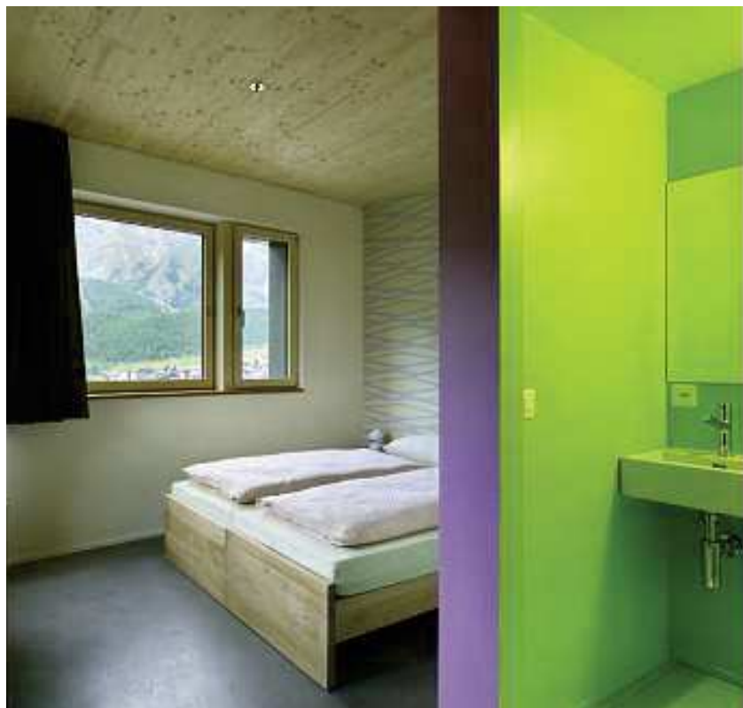
Das Hostel verfügt über 168 Betten in Sechser-, Vierer- und Doppelzimmern.