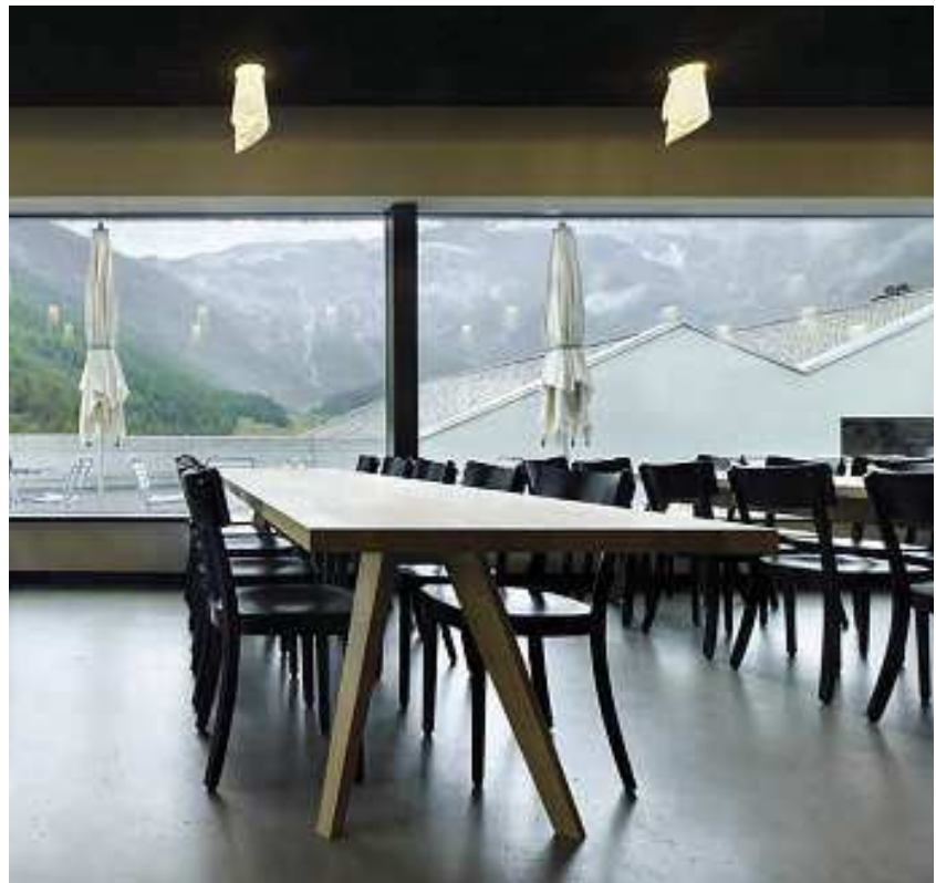
Das Panoramafenster verbindet den Speisesaal mit der vorgelagerten Terrasse.

Während Grundfläche und Disposition der einzelnen Zimmer in den Obergeschossen betont ökonomisch angelegt sind, strahlen die gemeinschaftlich genutzten Räume im Parterre eine offene und kommunikative Grosszügigkeit aus.